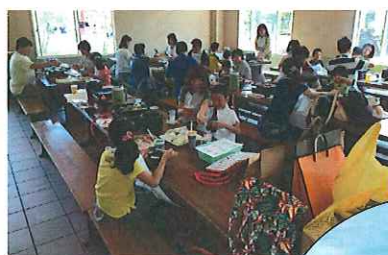
ブルーメの丘でのBBQ