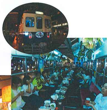
電車で揺られて・・・