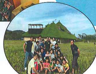
タネヤグループ ラコリーナにて